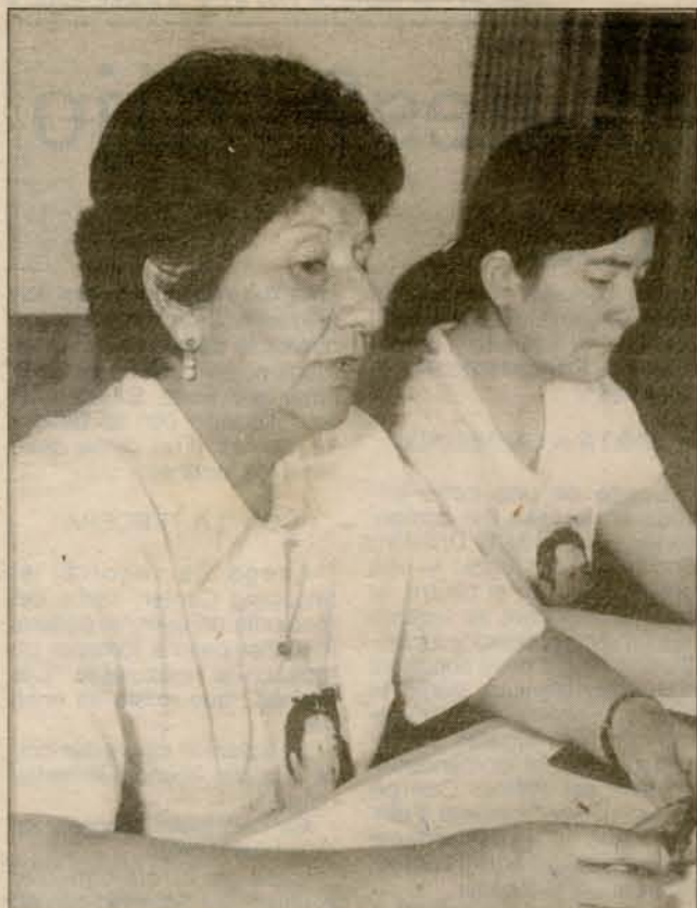
Sola Sierra, presidenta de la Agrupación de Familiares de Detenidos Desaparecidos.