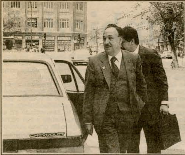
Ministro Luis Correa Bulo: Mañana reasume la investigación del secuestro del joven ejecutivo periodístico Cristián Edwards del Río.