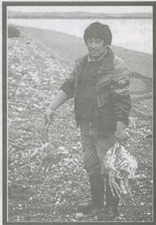
Pescador Chilote con Centollas

De esta manera Lo Prado mostró su espíritu solidario, siendo además, la única comuna de la Región Metropolitana en cooperar con nuestros hermanos del Sur.