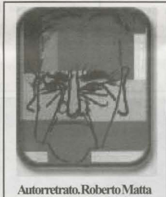
Autorretrato. Roberto Matta

apoyo cultural la gente va a tener otra idea, otra vista de las cosas, otra esperanza. Por que como dice el tema, la cultura es soñar, pero se tienen que hacer realidad, por que los sueños no pueden quedar en sueños, y lo que buscamos es que nuestros sueños se hagan realidad".