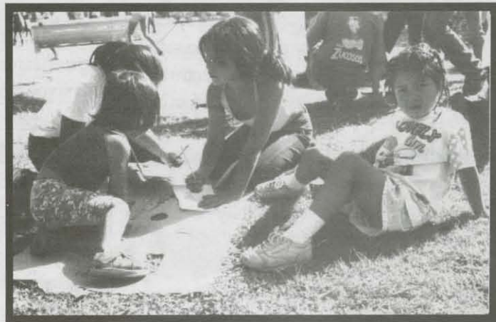
Niños jugando. Guiados por jóvenes del colectivo