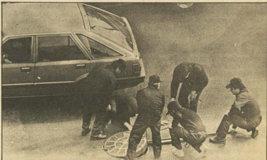
SANTIAGO, Chile: Expertos en explosivos de la Central Nacional de Informaciones (CNI), la policía secreta del gobierno militar chileno, examinan todas las alcantarillas de la Avenida Bernardo O'Higgins, la principal de Santiago, cinco horas antes del paso por el lugar del general Augusto Pinochet, que concurrirá a un desfile militar con ocasión de las Fiestas Patrias.

A las 17:23 horas volvió a pasar el escuadrón de estandartes frente a la tribuna presidencial. Era la señal que marcaba el fin del desfile. Reapareció el vehículo japonés del general Vidal, quien le informó a Pinochet que todo había concluido. Un parque automotriz inició entonces el operativo de retorno. Movimientos rápidos como nerviosos. Decenas de hombres con los dedos en los gatillos. Clima de tensión y de guerra con ministros civiles que sonreían a la prensa.