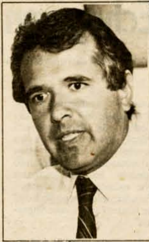
Cardoen no olvida lo sucedido.

—No es efectivo. La industria, como toda empresa, está sometida a las normales inspecciones del Trabajo.