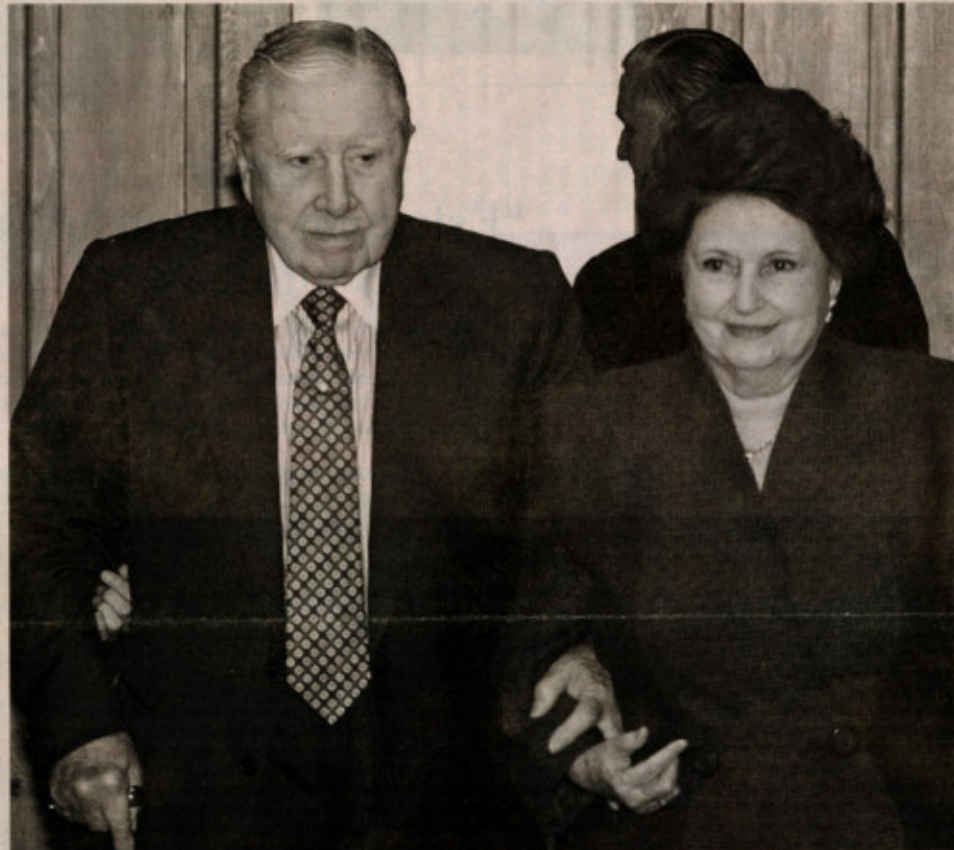
EL MATRIMONIO PINOCHET-HIRIART debe explicar a la justicia el origen de los casi US$ 8 millones detectados en el Banco Riggs de Estados Unidos. Además, deberán responder al SII si tributaron o no los dineros recibidos por años desde esa entidad en calidad de utilidades por intereses.

► El manejo de los fondos en la era posterior al Riggs, entre 2002 y 2004, se hizo a través de un fideicomiso en el Banco de Chile de Nueva York y su administración se entregó a un operador bursátil norteamericano de alto nivel. Durante el mismo período, las utilidades se destinaron a un aporte mensual para cada uno de los integrantes del clan Pinochet-Hiriart, sobre los cuales no está claro si tributaron correctamente.