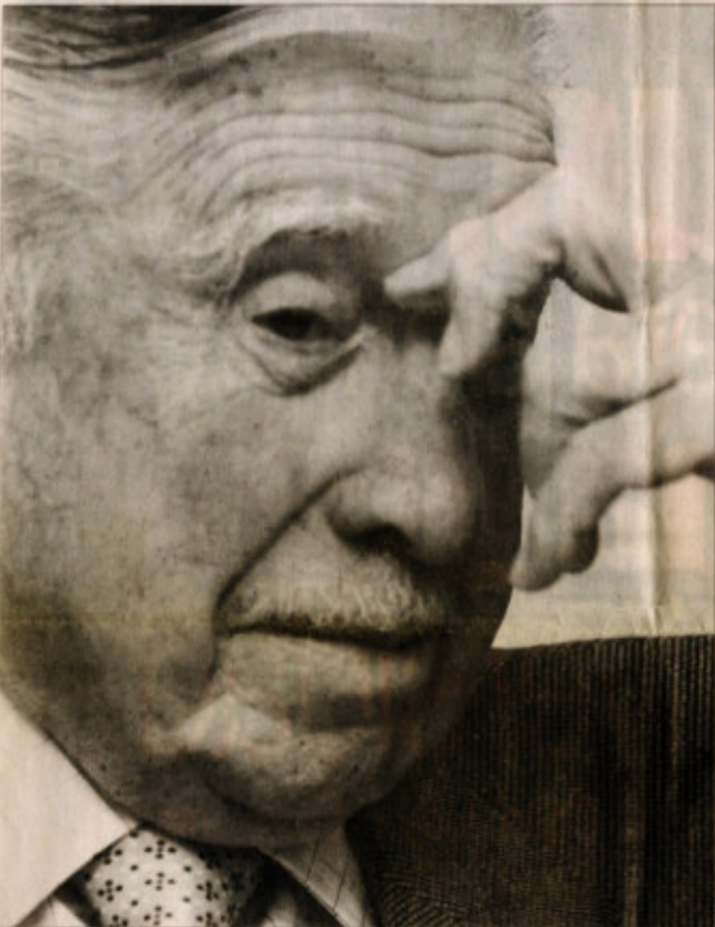
OTRAS IDENTIDADES.— "Daniel López" sólo fue uno de los varios nombres que empleó Pinochet en el Riggs.