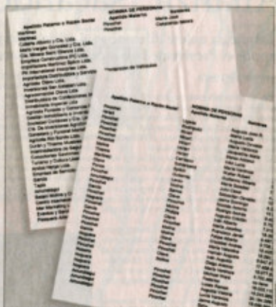
DOCUMENTO.—El oficio enviado por la SVS a los corredores de bolsa contiene la nómina de personas y sociedades a investigar.