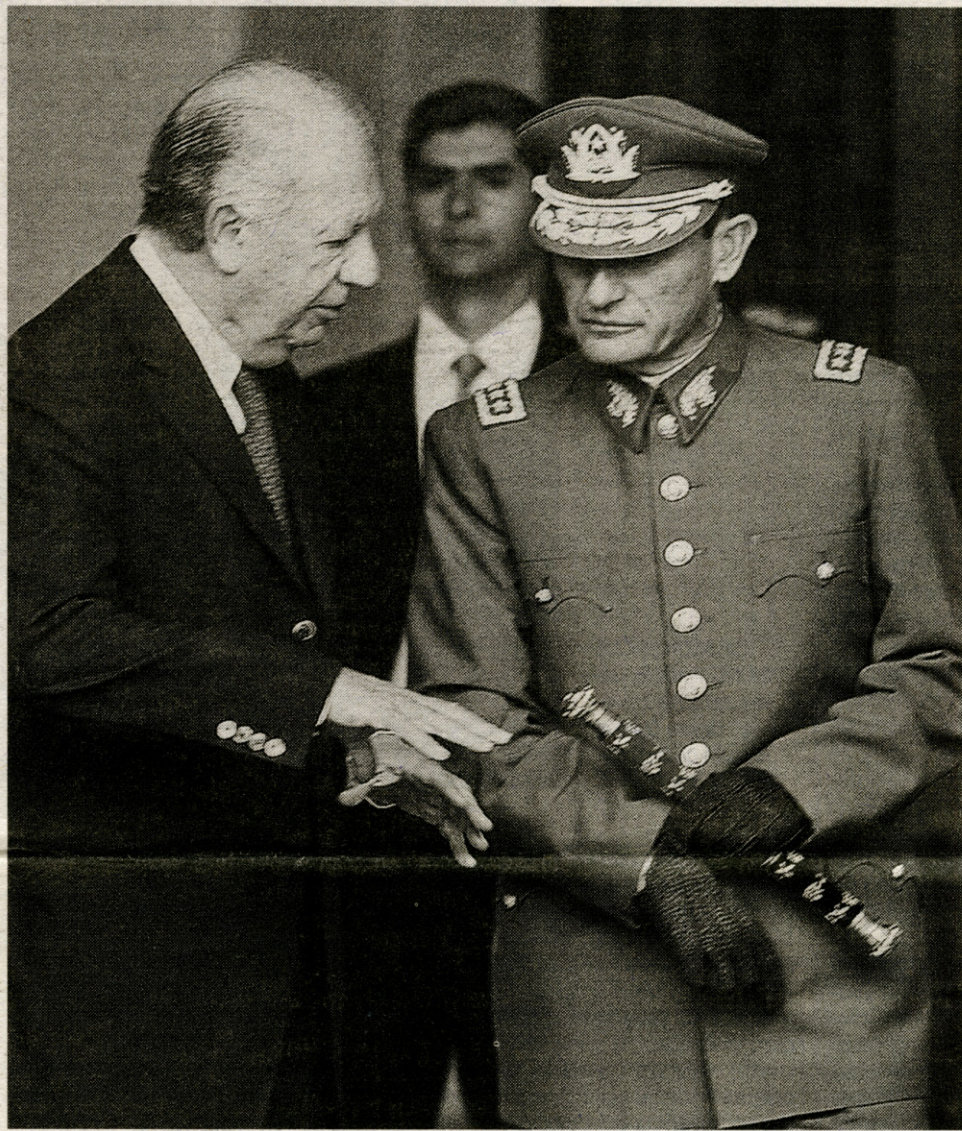
EL PRESIDENTE Ricardo Lagos fijó la reunión con Cheyre para la próxima semana, porque estos días tiene su agenda copada con el Apec.

Pero, además, el fallo comenzó a generar ruidos en el frente interno de Cheyre, en particular entre los militares en retiro que miran con recelo que los numerosos gestos en materia de derechos humanos que ha hecho el jefe castrense desde