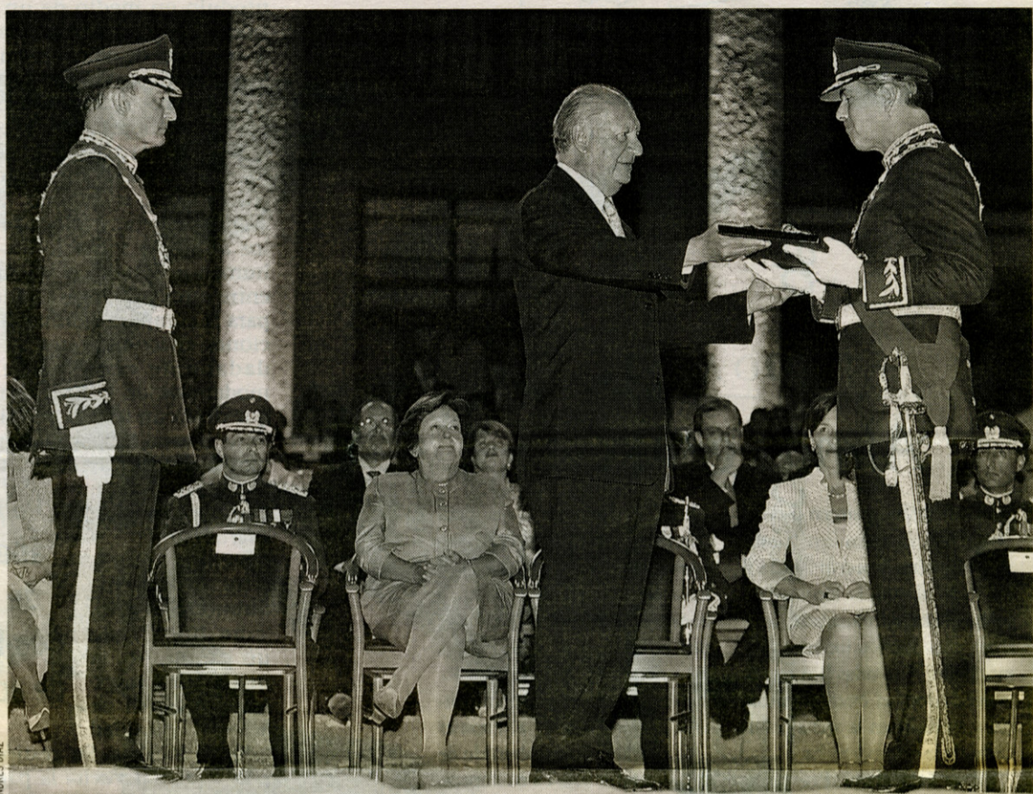
EL GENERAL CHEYRE observa al Presidente Ricardo Lagos entregando a su sucesor, Oscar Izurieta, el sable de José Miguel Carrera durante la ceremonia de traspaso de mando realizada anoche en la Escuela Militar.

"Es probable que hayamos alcanzado lo más importante (...) que (el Ejército) haya llegado a ser percibido, nuevamente, como el Ejército de Chile y de todos los