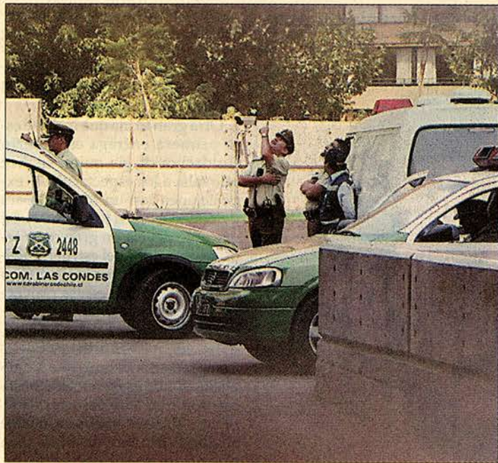
SITIO DEL SUCESO. — Efectivos de la 17.a Comisaría de Las Condes realizan los primeros peritajes en el frontis del edificio ubicado en calle Pío XI.

El suicidio será investigado por el 32° juzgado del Crimen.