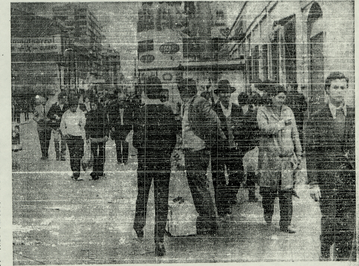
Apenas levantado, a las 12 horas de ayer, el toque de queda, muchas personas se dirigieron al Mercado Central para adquirir productos comestibles. Peatones aparecen en el grabado cuando caminan por la calle Puente

En forma extraordinaria se informó que el gerente comunista de Chucucamata y un grupo no determinado de ejecutivos y dirigentes de la Unidad Popular de ese minera, se internó en el desierto con vehículos y elementos suficientes para un largo viaje.