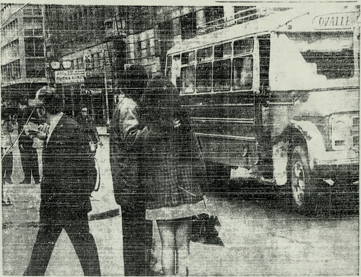
En forma parcial trabajó ayer la locomoción colectiva, tanto por las dificultades en reactivar las máquinas como por las prohibiciones de salir en sus recorridos al centro de la ciudad. En provincias la normalidad en este aspecto es casi total. En el grabado, uno de los primeros autobuses llega a las cercanías del centro de Santiago

Hoy debe quedar normalizada la fabricación de pan, que fue suspendida tanto por la falta de materia prima como por la imposibilidad de los panificadores de movilizarse problema que fue solucionado en gran parte en el día de ayer.