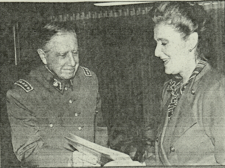
"He encargado que se realicen estudios sobre el futuro de la CNI para arribar a una solución que garantice mejor los intereses de todos los chilenos", dice el Presidente de la República.

P.- ¿Cuál debe ser, a su juicio, el rol de las Fuerzas Armadas después del 11 de marzo de 1990?