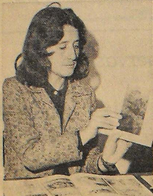
"LLEGO TAN AGOTADA a casa, que solo pienso en dormir". En el día, trabajo y trabajo...

Se estableció en ese barrio de colores, al otro lado del río, donde el arte sale de piezas altas, de escaleras angostas, patios de luces y ventanales subdivididos hasta el infinito por vidrios y más vidrios. En ese barrio donde la pintura aleja a la vejez, a lo carcomido.