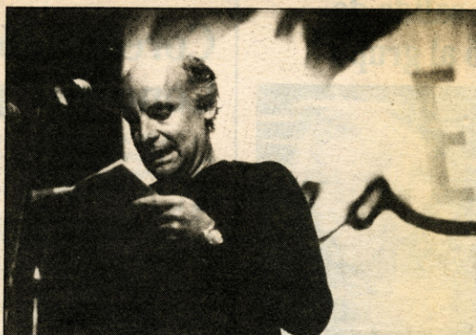
Eduardo Galeano lee el discurso a nombre de los invitados.

Se inició el Encuentro Internacional del Arte, la Ciencia y la Cultura por la Democracia en Chile