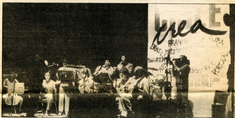
Barroco Andino en el escenario del teatro con el cartel del encuentro a sus espaldas.

Cerca de dos mil personas repletaron el Teatro Baquedano y otras tantas no lograron ingresar a la sala. En medio del acto se recordó al poeta Enrique Lihn y un largo aplauso se convirtió en un homenaje. También se leyeron saludos de Serrat, Claudia Cardinale y Graham Greene, entre otras personalidades.