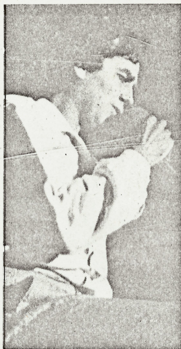
El cantante Joan Manuel Serrat, el

Tres destacados artistas plásticos, el francés Ernest Pignon, el catalán Josep Guinovart y Juan Genovés, residente en Madrid, enviaron sus diseños gráfi-