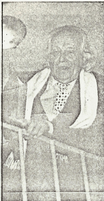
escritor británico Graham Greene y el poeta español Rafael Alberti.