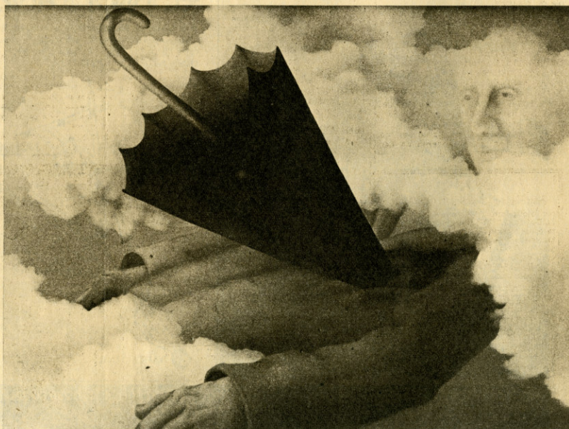
Una alegórica obra de la pintura Gabriela Vargas en solidaridad con el pueblo chileno