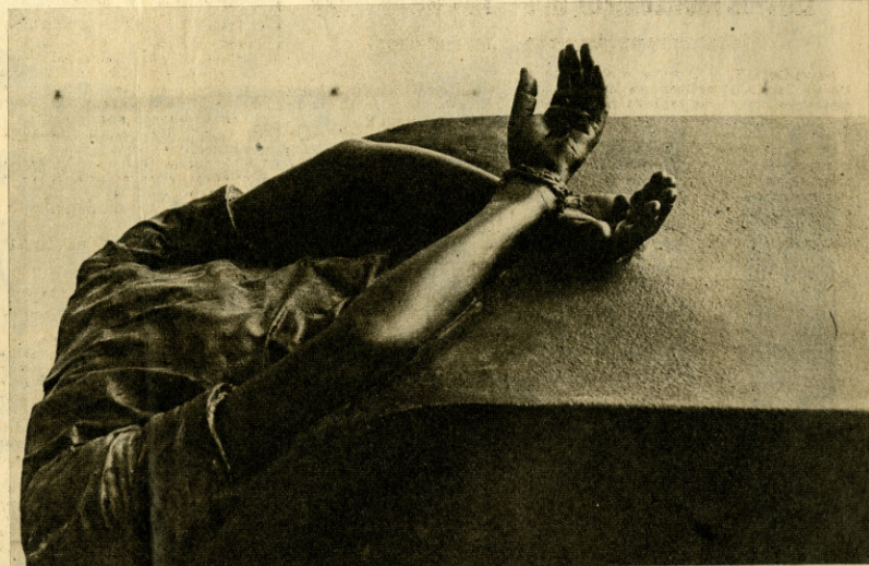
Una impresionante escultura de Rafael Canogar, titulada "El Yacente", y de dimensión humana

El antecedente próximo del Museo de la Resistencia, que ahora actúa como un verdadero museo en el exilio, es el Museo de la Solidaridad, fruto de una idea que nació en Chile, a raíz de la Operación Verdad, convocada por el propio Salvador Allende, quien llamó a todos los escritores y artistas demócratas en apoyo del proyecto político y humano de la Unidad Popular. De ahí que las palabras recogidas en el programa de la