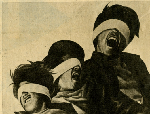
Juan Genovés realizó para el Museo esta pintura llamada "El grito"

En el Museo hay numerosas muestras del llamado "arte inculto". La fotografía muestra diversos trabajos dentro de esta línea, efectuados por esposas de presos y fugados chilenos, con emotivos matices