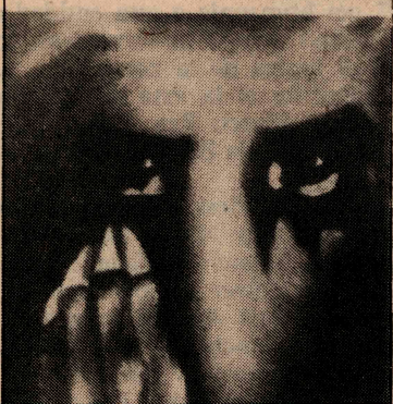
Díptico de Flavia Tótoro en Espacio Arte (Las Urbinas 130) y el cuadro de Matta, en la sala Carmen Waugh.