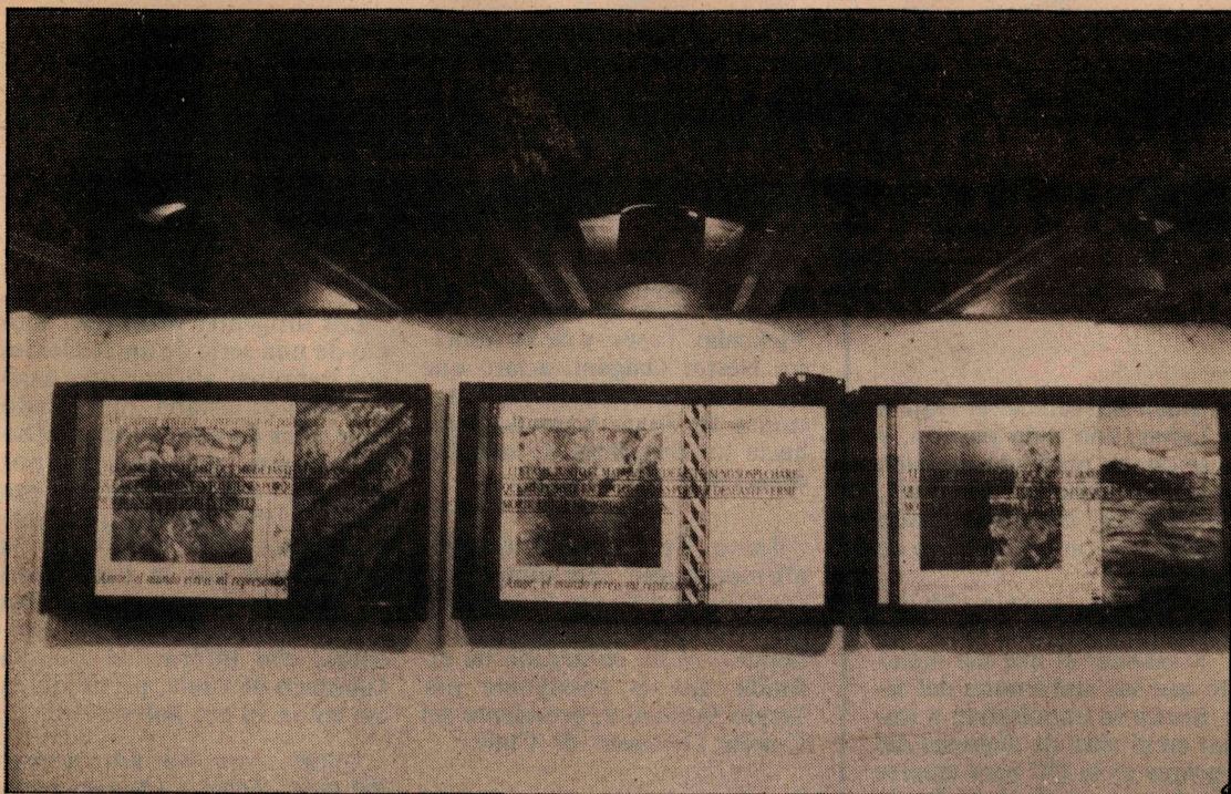
En las galerías Carmen Waugh, Enrico Bucci, Apech y Espacio Arte